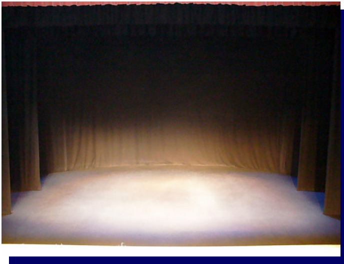
Fondo negro en forma semicircular