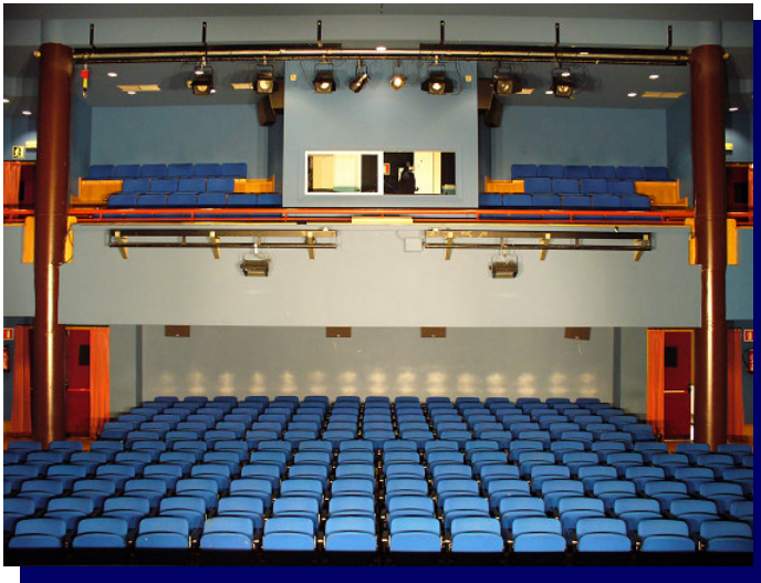
Sala de 240 localidades en 2 plantas - Cabina en el centro del anfiteatro