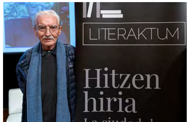
Patri Urkizu lagunartean © Iñaki Rubio