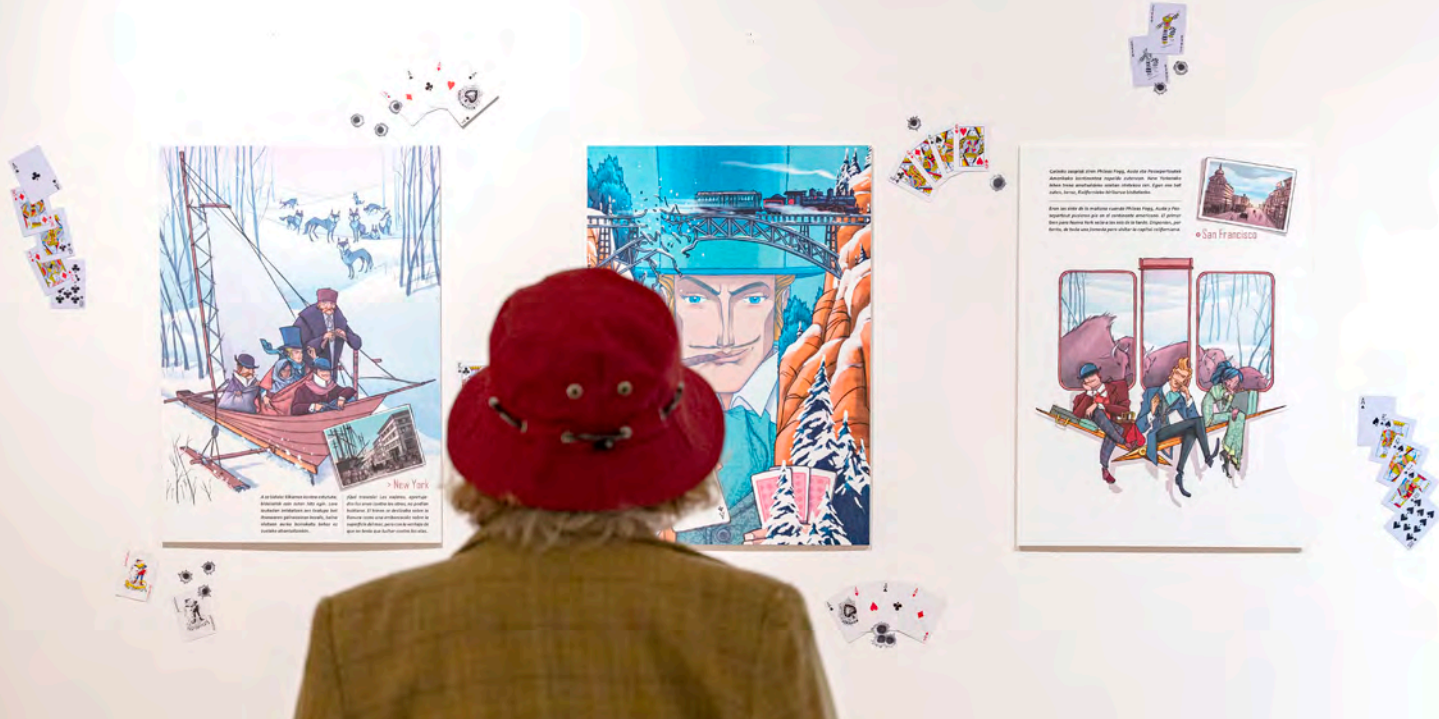
Munduari itzulia 80 egunetan erakusketa

Literaturako lan berriek ere izan zuten euren espazioa literaturaren jaialdian, kasu honetan Gioconda Belliren, Patxi Zubizarretaren eta Antje Rávic Strubel idazle alemaniarraren eskutik.